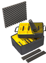
1607AirDS Divisores acolchados