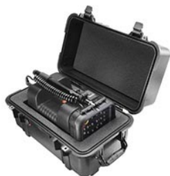
1460AALG 1460 Schutzkoffer mit passendem Schaumstoffeinsatz