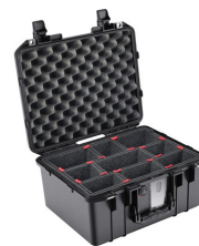
1507TP With TrekPak Divider System