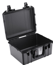
1507NF No Foam