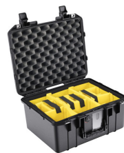
1507WD With Padded Dividers