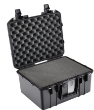
1507WF With Foam