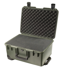
iM2620-X0001 With Foam