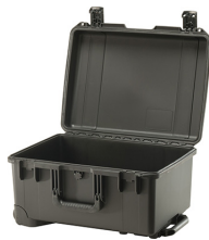
iM2620-X0000 No Foam