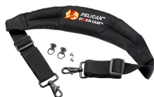
iM-STRAP-S-VER2 Padded Shoulder Strap