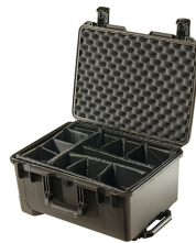
iM2620-X0002 With Padded Dividers