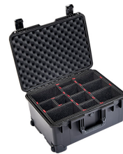
iM2620-X0006 With TrekPak Divider System