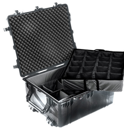
1694 With Padded Dividers