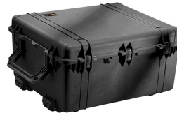
1690NF No Foam