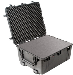
1690WF With Foam