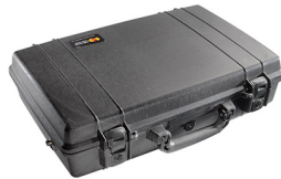
1490NF No Foam