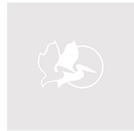
AL4824-1404RPFC With Foam, With Casters