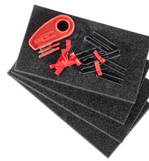
1506TPKIT TrekPak Koffer Teiler Kit