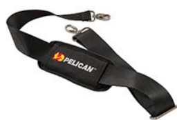
9487 Padded Shoulder Strap