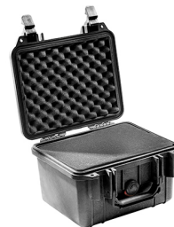
1300WF With Foam