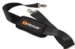
9487 Correa para hombro acolchada