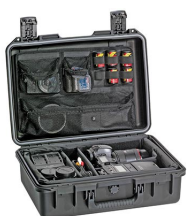
iM24XX-PHOTOPALLET Pálet para fotografía