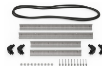
iM2450-MBEZ-B Bisel de la base (métrico)