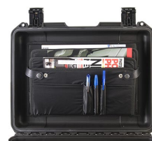
iM24XX-LIDORG Organizador de tapa