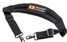
iM2370-STRAP-S Correa para hombro acolchada removible