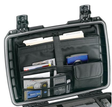
iM2370-UTILITYORG Organizador de accesorios