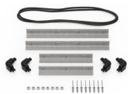
iM2200-MBEZ-B Bisel de la base (métrico)