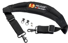
iM-STRAP-S-VER2 Correa para hombro acolchada