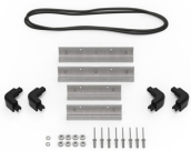
iM20XX-M4-BEZEL Bisel de la base (métrico)