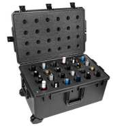
WINE-24B 24-Bottle Wine