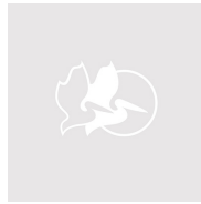
iM2975-X0002 With Padded Dividers