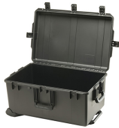
iM2975-X0000 No Foam