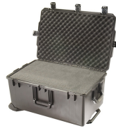
iM2975-X0001 With Foam