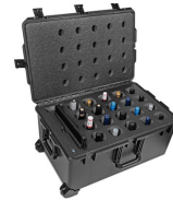
WINE-20B 20-Bottle Wine