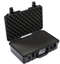
1485WF With Foam