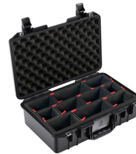
1485TP With TrekPak Divider System