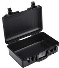
1485NF No Foam