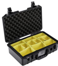
1485WD With Padded Dividers