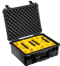
1554 With Padded Dividers