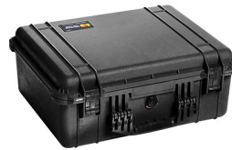
1550NF No Foam