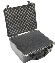
1550WF With Foam