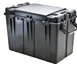
0500WF With Foam