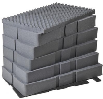
0501 7 St. Ersatz- Schaumstoffeinsätze