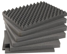
iM2720-FOAM 5 St. Ersatz-Schaumstoffeinsätze