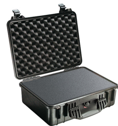
1520WF With Foam