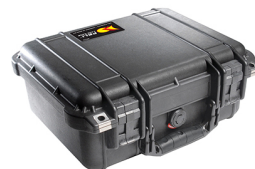
1400NF No Foam