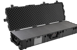
1770WF With Foam