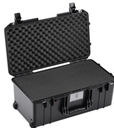
1556WF With Foam