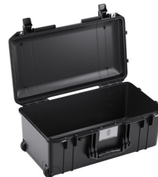
1556NF No Foam