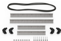
iM2300-MBEZ-B Bodenlünette (metrisch)