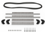
iM2300-M4-BEDEL-L Deckel-Lünette (metrisch)