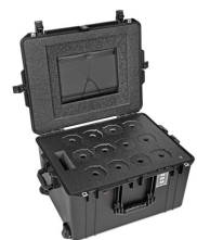
WINE-12B 12-Bottle Wine