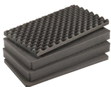
1555AirFS Комплект запасных прокладок из вспененного материала (4 шт.)