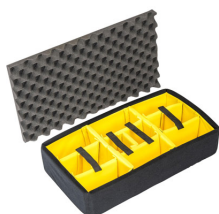
1555AirDS Комплект мягких модульных перегородок