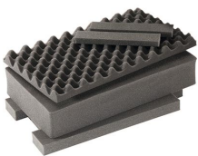
1535AirFS Комплект запасных прокладок из вспененного материала (3 шт.)