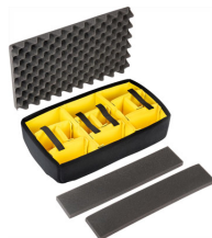
1535AirDS Комплект мягких модульных перегородок