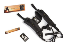
RucPac-normal RucPac Standard Hardcase Backpack Conversion