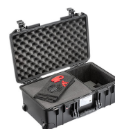
1535AIRTPF TrekPak / Foam Hybrid