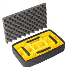
1485AirDS Комплект мягких модульных перегородок