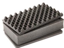
1485AirFS Комплект запасных прокладок из вспененного материала (3 шт.)