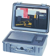
1509 Отделения на крышке