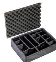
1525 Комплект мягких модульных перегородок