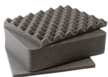
1401 Комплект запасных прокладок из вспененного материала (3 шт.)