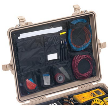
1609 Отделения на крышке