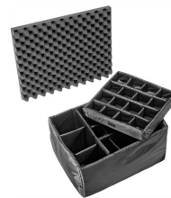
1625 Комплект мягких модульных перегородок