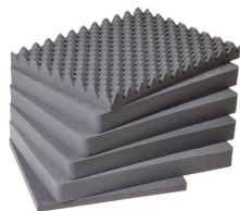
1621 Комплект запасных прокладок из вспененного материала (6 шт.)