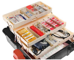
1466 Tray System for 1460EMS