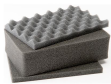
1121 Комплект запасных прокладок из вспененного материала (3 шт.)