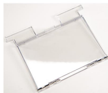
1630DC Дополнительный карман для хранения документов