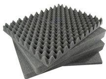
1771 Комплект запасных прокладок из вспененного материала (4 шт.)