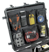
1699 Отделения на крышке