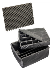
1695 Комплект мягких модульных перегородок