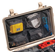
1519 Отделения на крышке