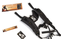
RucPac-normal RucPac Standard Hardcase Backpack Conversion