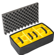
1515 Комплект мягких модульных перегородок