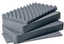
1511 Комплект запасных прокладок из вспененного материала (4 шт.)