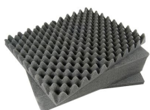
1491 Комплект запасных прокладок из вспененного материала (3 шт.)