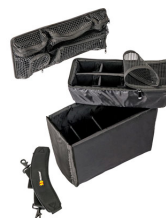
1435 Комплект мягких модульных перегородок