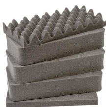
1431 Комплект запасных прокладок из вспененного материала (5 шт.)