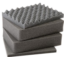
1301 Комплект запасных прокладок из вспененного материала (4 шт.)