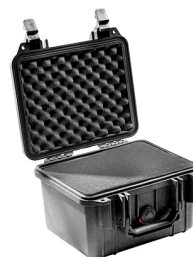
1300WF With Foam