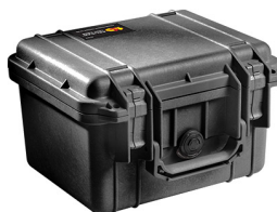
1300NF No Foam