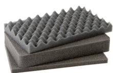
1171 Комплект запасных прокладок из вспененного материала (3 шт.)