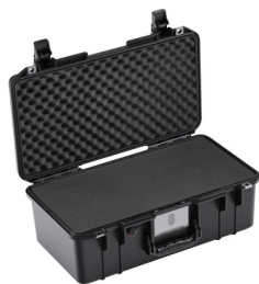
1506WF With Foam