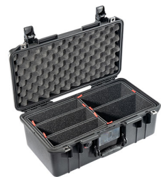
1506TP With TrekPak Divider System