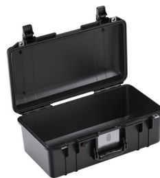
1506NF No Foam