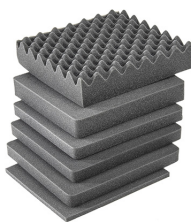
iM2275-FOAM Комплект запасных прокладок из вспененного материала (4 шт.)