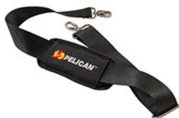
9487 Padded Shoulder Strap