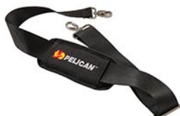
9487 Padded Shoulder Strap