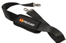
9487 Padded Shoulder Strap