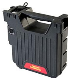
9489 Портативный источник питания