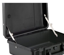
iM-LIDSTAY Кронштейн для опоры откидной крышки