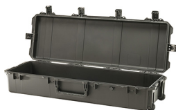
iM3220-X0000 No Foam