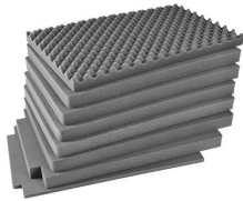
iM2975-FOAM Комплект запасных прокладок из вспененного материала (8 шт.)