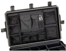
iM29XX-UTILITYORG Отделения для предметов общего назначения