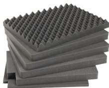
iM2720-FOAM Комплект запасных прокладок из вспененного материала (5 шт.)