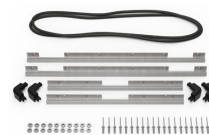
iM2720-M4-BEZEL-L Lid Bezel Kit (Metric)