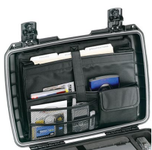
iM2370-UTILITYORG Отделения для предметов общего назначения