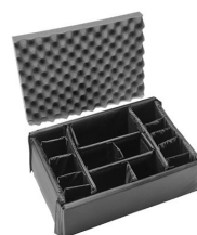
iM2370-DIV Комплект мягких модульных перегородок