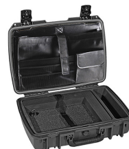
iM2370-X0003 Computer Case Deluxe