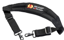
iM2370-STRAP-S Removal Padded Shoulder Strap