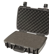
iM2370-X0001 With Foam