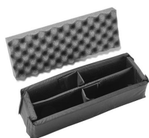
iM2306-DIV Комплект мягких модульных перегородок