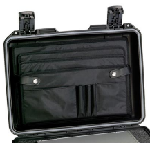
iM2300-LIDORG Отделения на крышке