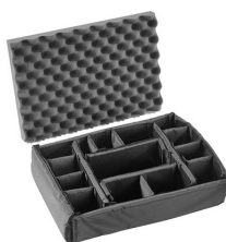
iM2300-DIV Комплект мягких модульных перегородок